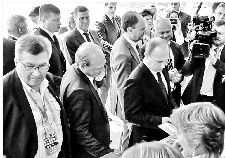
Красная площадь: читатели

Телефестивали Тюмени объединяли всё юное телесообщество тогдашней области: север – юг. Учили, учились, соревновались и все вместе побеждали. «Белые пятна истории Сибири», «Бабье лето в Увате», «Экстракамера», «Хвост удачи», «Россия – doc.TV. Тюмень». Мы первыми в истории