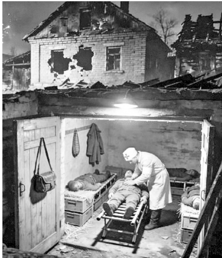
Изображение сгенерировано ChatGPT Полиной СМОЛЬНИКОВОЙ

Автомат под левой рукой вжат в снег. И тут осенило: он, Саня, не дался! Была торопливая пальба друг в друга. Дуэль! Он был охотничьи быстр и чертовски везуч!