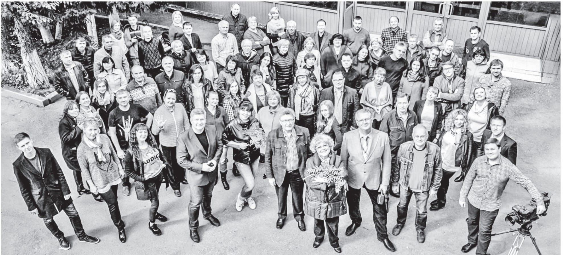
Все в сборе: телерадиокомпания эпохи Омельчука