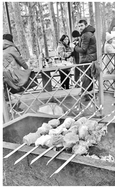
Шашлыки в Гилёвской роще точно по ГОСТу