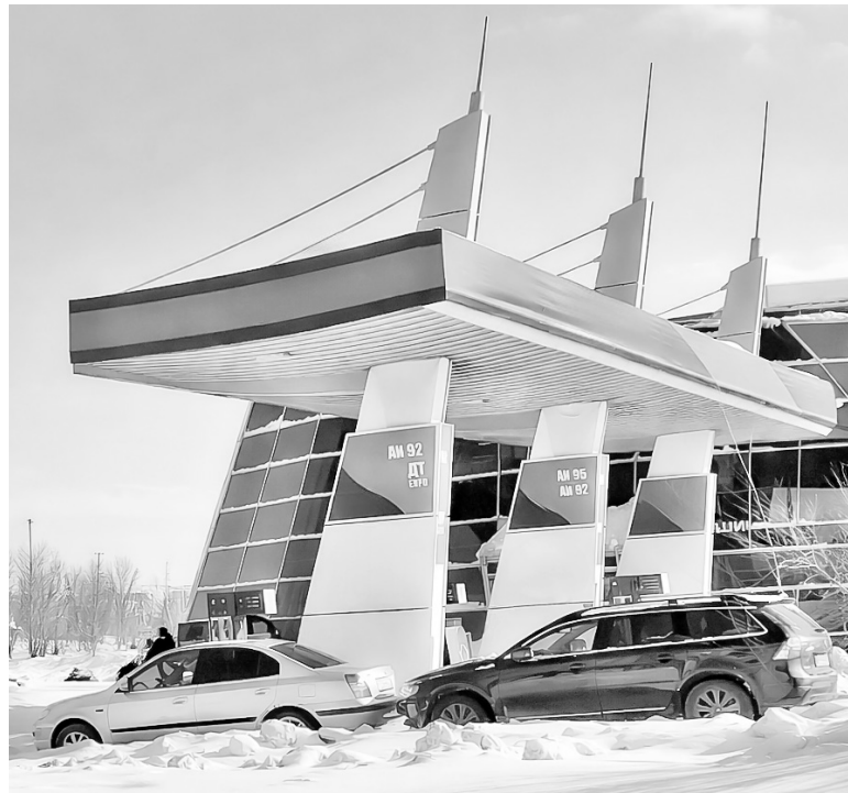
Как заправишься – так и поедешь

Автора снова потянуло в историю. Пошла художественная часть. Память хранит незабвенного Василия Алибабаевича, который разбавлял бензин ослиной мочой. За то и сидел. У нас такое невозможно, потому что нет в наших краях арела сих копытных. Возможен иной вариант. На форуме автомобилистов земляк поведаль: