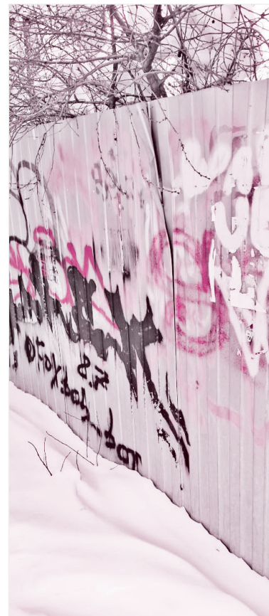
Самые невинные каракули...