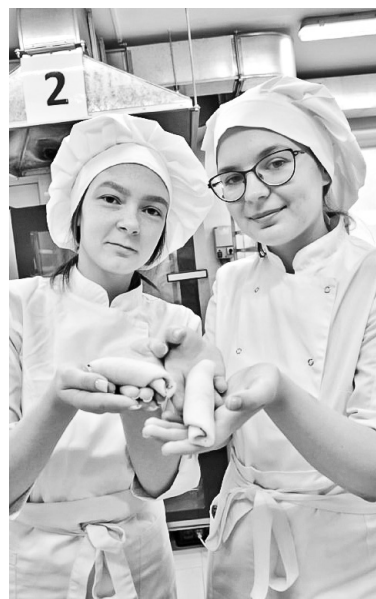
Когда сделано с душой и по технологии

Шибко сомневаюсь насчёт высокосортной говядины, скорее всего, мясо в Нижневартовск завозят в замороженном состоянии. Во всём плохом советуют искать нечто хорошее. В бочке дёгтя можно ведь обнаружить каплю мёда. Так вот, кило «докторской» от 1936 года стоило бы вам не менее 1 000 рублей. За теперешнюю палку (500 г.) я отстегнул всего-то 364 рубля 99 копеек. И рад: вкус специфический.