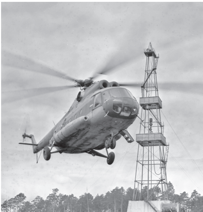
Без вертолёт – ну никак!

Так сложился оригинальный архитектурно-ландшафтный стиль города: набережная реки Ингуягун, парк аттракционов, два 16-этажных дома, здание городской администрации, музейно-выставочный комплекс... Современный город-красавец Когалым: благоустроенные дома, Рябиновый бульвар, изящные скульптурные композиции, мемориал защитников Отечества, культурно-досуговые центры «Янтарь» и «Галактика», здание филиала московского Малого театра, памятник «Героям-нефтяникам, участникам освоения Западной Сибири» и храм в честь святой мученицы Татианы, первая в Югре церковь с пятью малыми куполами и двухъярусной звонницей