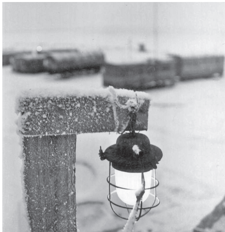
Когда метёт – фонарь спасёт