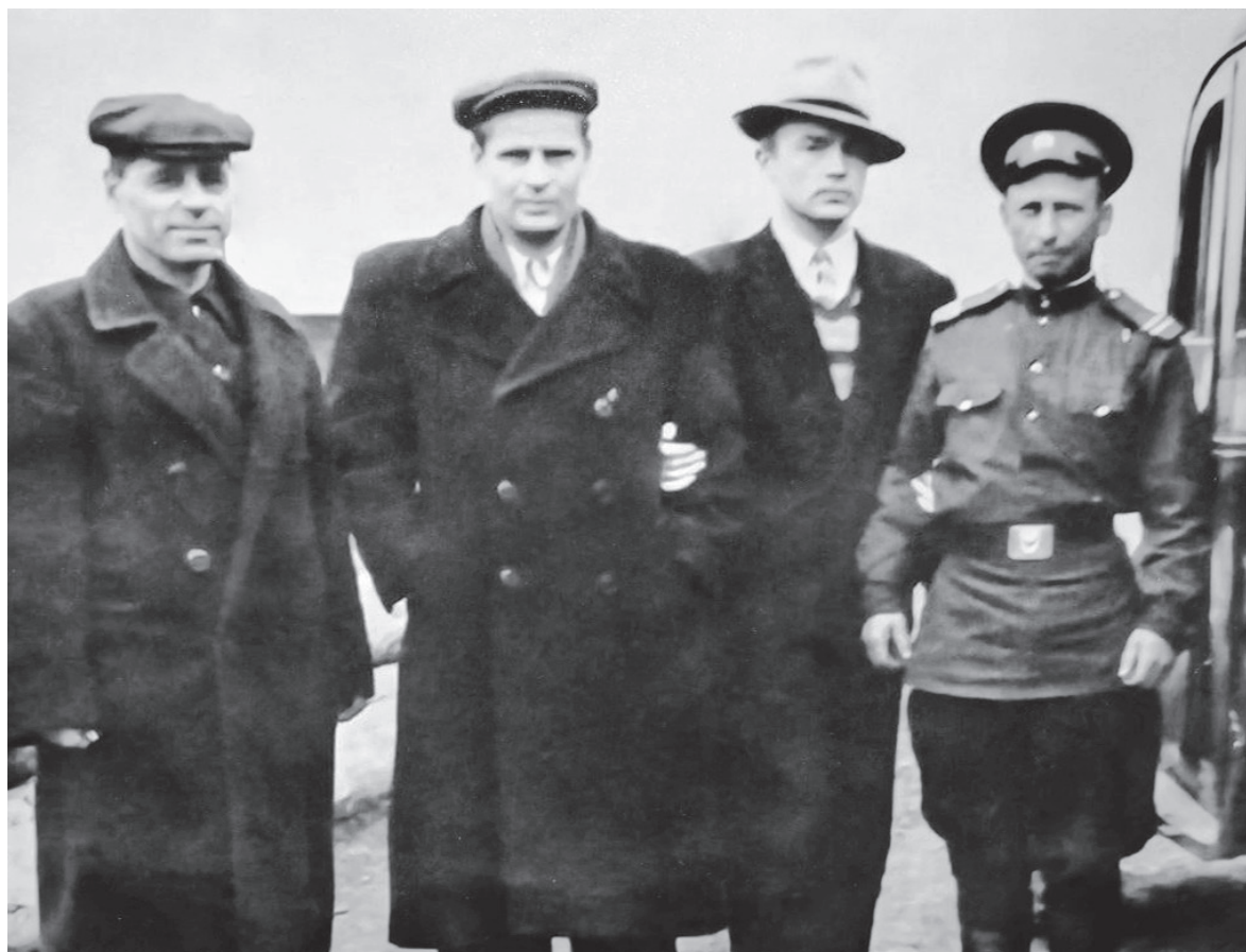
Молодцу шляпа к лицу

До Каверина, впрочем, дело не дошло. В следующем учебном году Маршака в классе уже не было. Укатил на свою историческую родину – в Москву, а вместе с этим