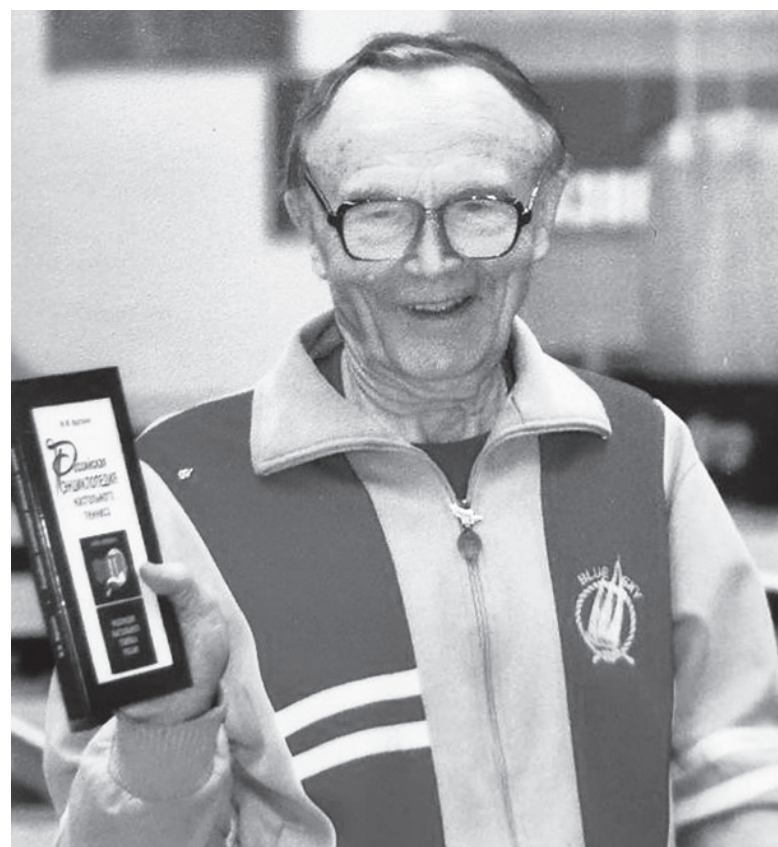
Главное – не сдаваться!