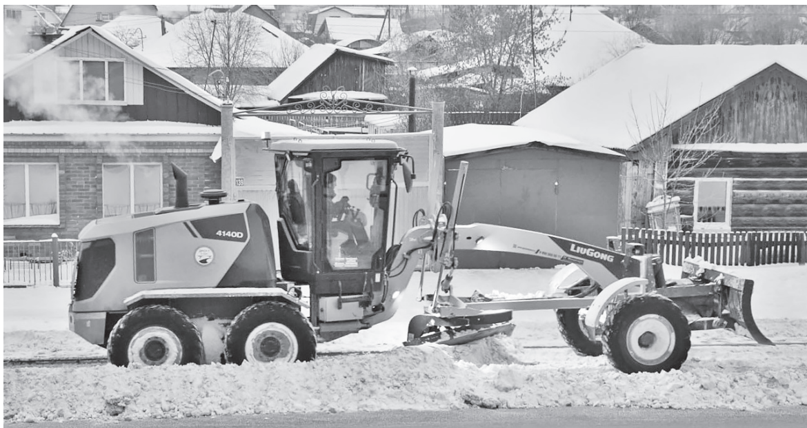
Предмет зависти спецов прошлого