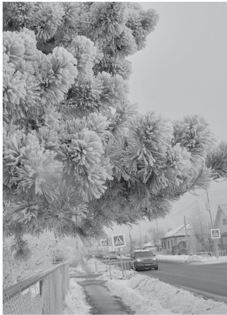
Ёлка под шубой