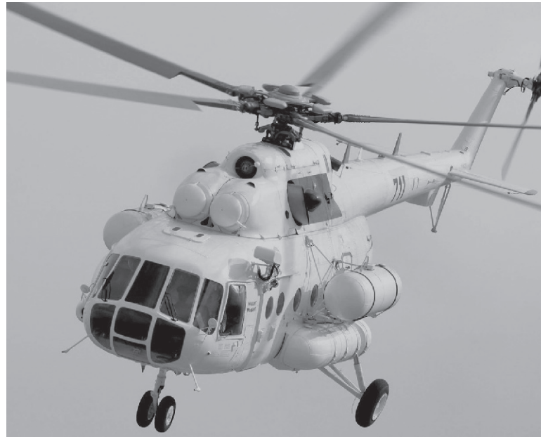
Винтокрыл пошёл на посадку