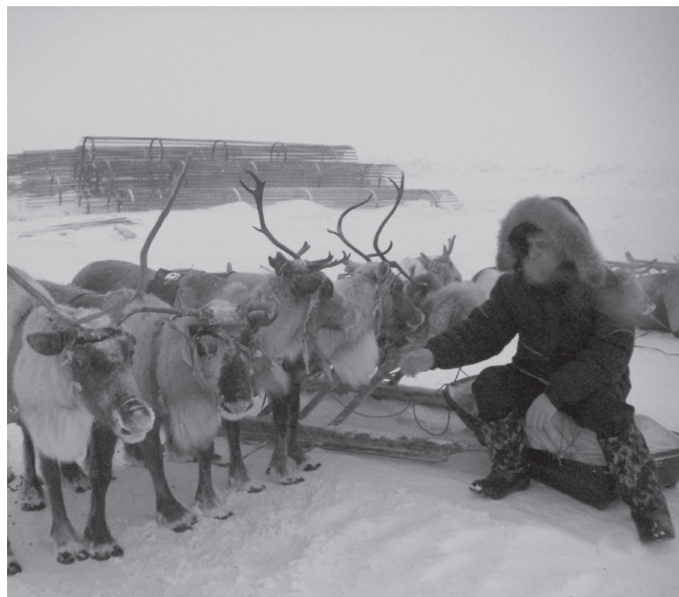
У оленей тоже праздник