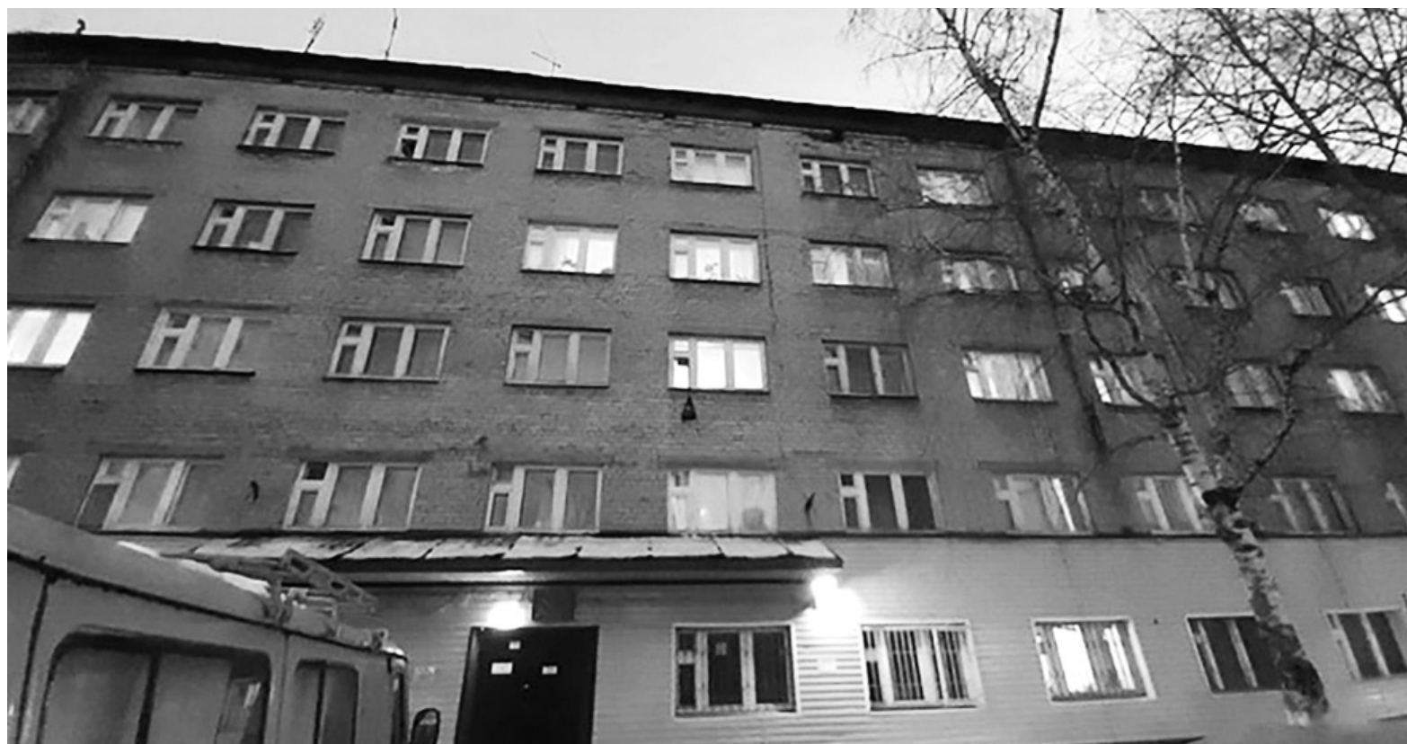
На снимке тот самый спорный дом по Луначарского, 19