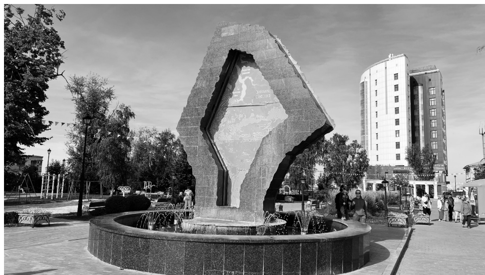
Стела «Тюменская область» на площади Борцов Революции